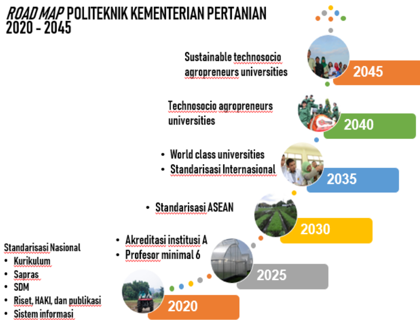
Gambar 1. Road Map Politeknik Kementerian Pertanian

Mengacu pada arah kebijakan BPPSDMP seperti tertuang dalam Renstra BPPSDMP 2020- 2024 dan Roadmap Politeknik Kementerian Pertanian 2020 – 2045 seperti tertera pada gambar berikut: